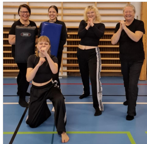
Feministiskt självförsvar med instruktörer från feministisksjalfvorsvar.se