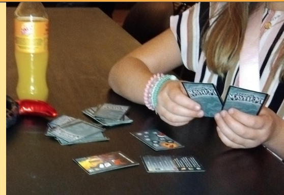
Brädspelskväll - Falu Fritid för unga + Nördliv