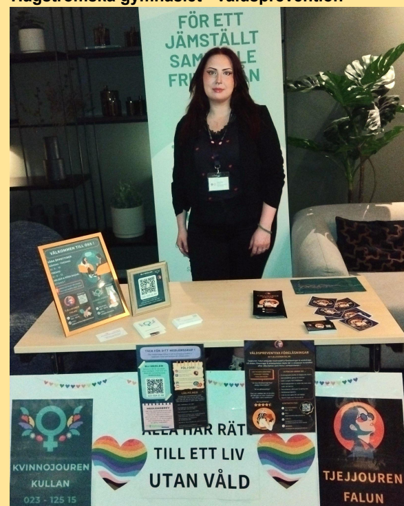
Tjejjouren på pridehouse