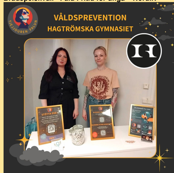
Hagströmska gymnasiet - våldsprevention