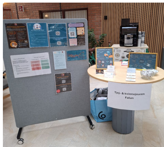
Forskning & Utbildningsdag Högskolan Dalarna